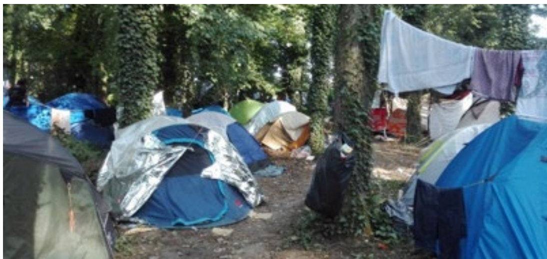
Camp à Grande-Synthe, août 2018

Les autorités ont mis en place un service régulier de maraudes pour permettre aux étrangers d'accéder à des centres d'accueil et d'examen des situations (CAES) ou des centres d'accueil et d'orientation (CAO), où ils peuvent également obtenir des informations sur la procédure d'asile. Les autorités françaises affirment que grâce à ces maraudes, tous les migrants et réfugiés à la rue peuvent être mis à l'abri et que personne n'est contraint de dormir dehors 19 .