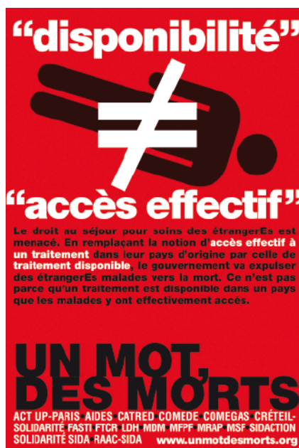
Campagne un mot, des morts, mars 2011

Président d'honneur de la Société Française de Santé Publique